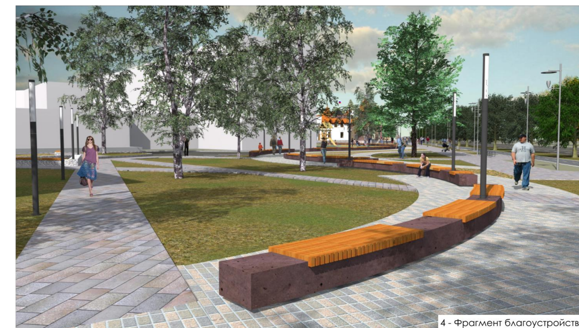
4 - Фрагмент благоустройства