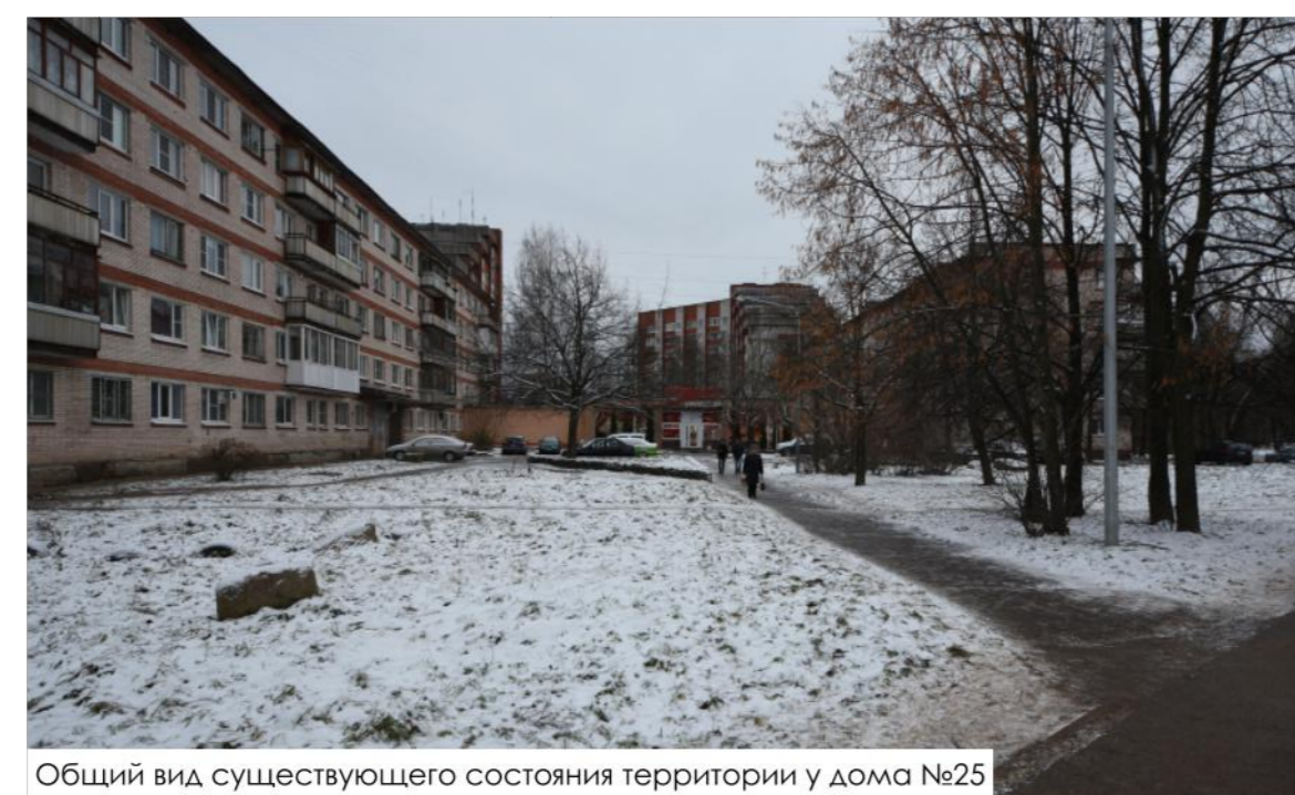
Общий вид существующего состояния территории у дома №225