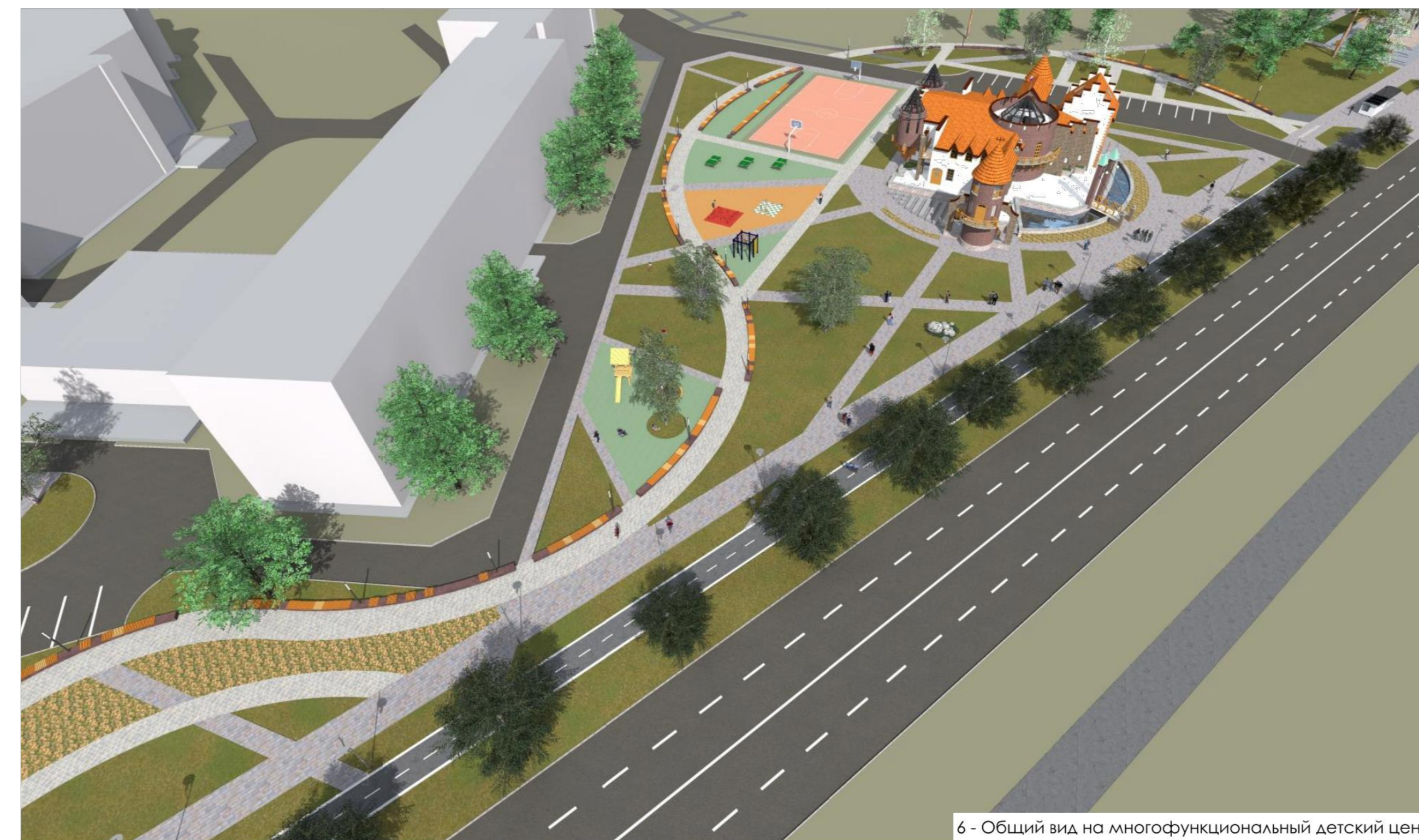
6 - Общий вид на многофункциональный детский центр