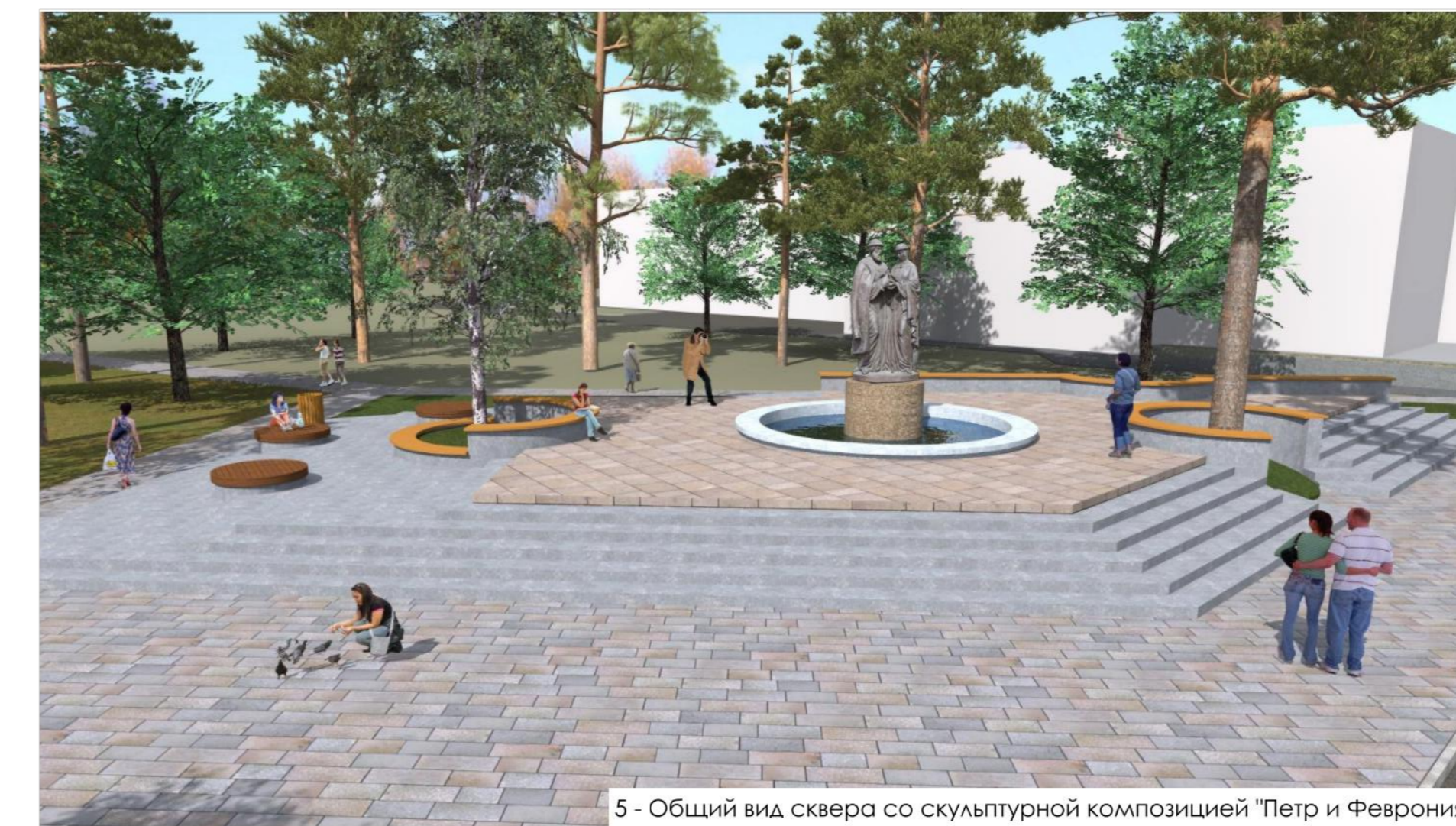
5 - Общий вид сквера со скульптурной композицией "Петр и Феврония"