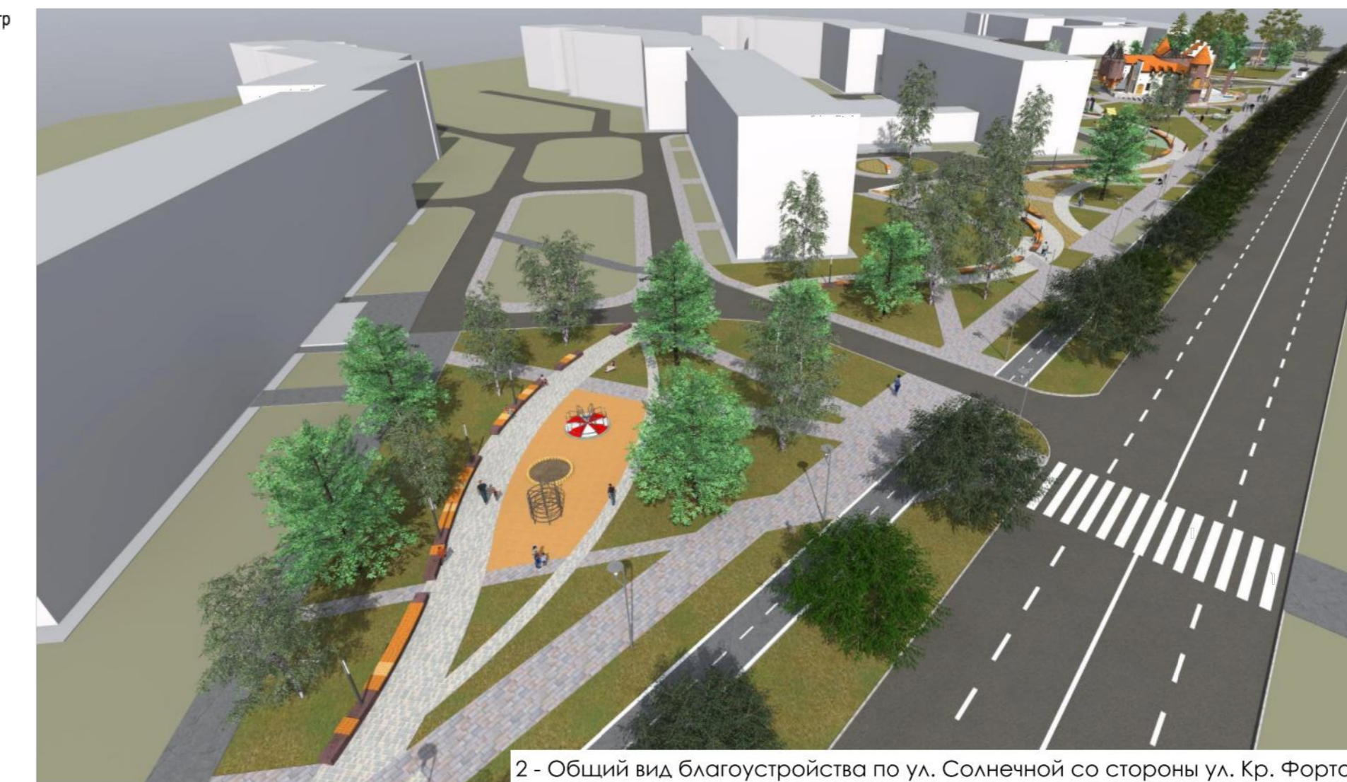
2 - Общий вид благоустройства по ул. Солнечной со стороны ул. Кр. Фортов