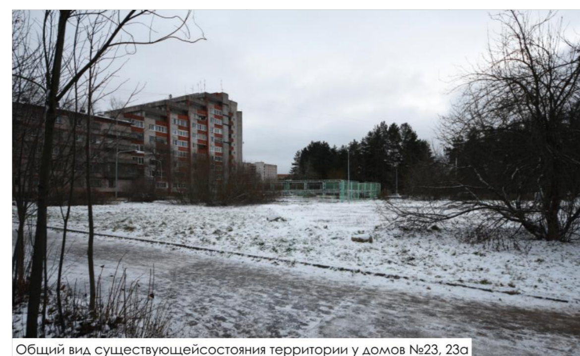
Общий вид существующего состояния территории у домов №23, 23а