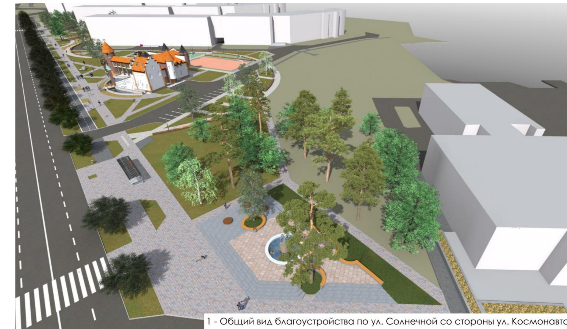
1 - Общий вид благоустройства по ул. Солнечной со стороны ул. Космонавтов